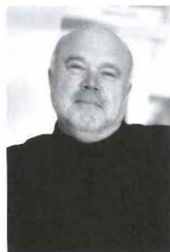
„ Uwe Staib Präsident des Bundesverbandes Schmuck + Uhren

Es sind die Menschen, die letztendlich 250 Jahre bewegte Geschichte der Pforzheimer Schmuck- und Uhrenindustrie ausmachen. Die Goldstadt ist das Ergebnis eines ganz besonderen Generationenvertrags, wie die Statements zahlreicher Protagonisten unterstreichen.